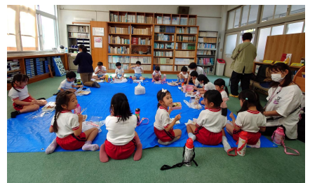
【5才児 お泊まり園外活動】 さとうみ科学館・長瀬海浜公園 キャンプファイヤー・バーベキュー 11月2日 鯛乃宮のやぶさんと一緒に