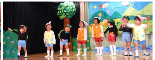
劇遊びと音楽の集い・和太鼓発表会